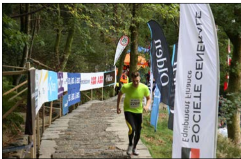
Sponsorene er viktige for Stoltzen

StoltzeÅret starter allerede i januar da vi møtes for første gang og tar en første gjennomgang av årets arrangement og blir enige om de viktige datoene. Deretter jobber vi med ulike prosjekter som vi har lyst å få gjennomført. Det er alltid forbedringsområder i planlegging og gjennomføringen. I mai er det påmelding og da er det «hardkjør» både i påmeldingssystemet og på mailboksene våre. Det er mye arbeid med å få på plass alle gruppene og enkeltstartende og administrering av innbetalingene er også blitt en egen stilling. Og løpende er det pågang på mailboksene våre der folk lurer på ting og som vi kontinuerlig prøver å følge opp. Og i august og september drar det seg skikkelig til med rensing av ledige gruppenr, salg av ledige startnr og klargjøring av en startliste som inneholder ca 6000 navn. Og de siste detaljene må på plass til folkefesten. Ivrige og dyktige klubbmedlemmer og andre gode hjelpere drar lasset såpass bra at vi hvert år får mange gode ord om arrangementet fra deltakerne. Det er kjekke tilbakemeldinger å få! Vi må bare stå på slik at vi holder kvaliteten oppe – takk til alle våre gode medhjelpere.