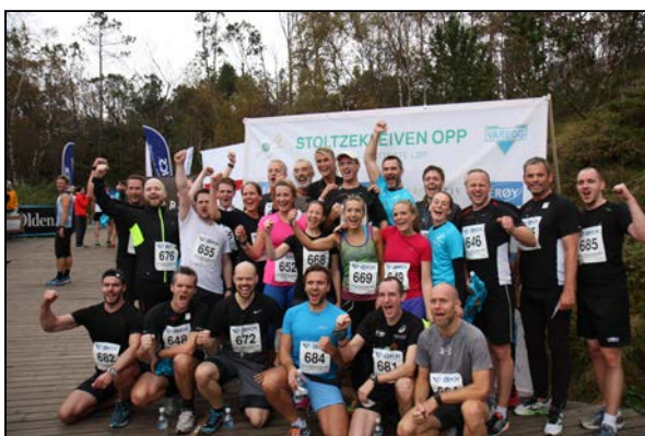
Gruppebilder på toppen skaper god stemning