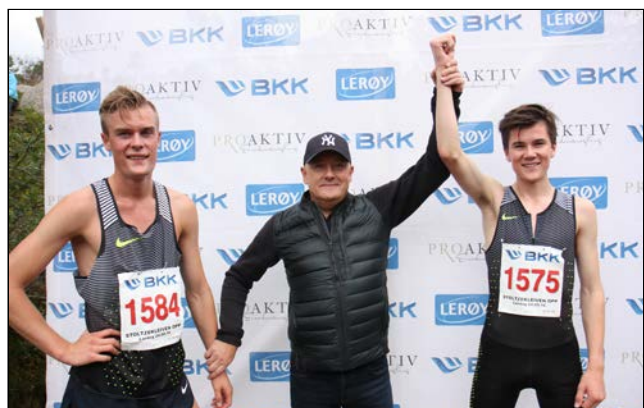
Team Ingebrigtsen var meget populære