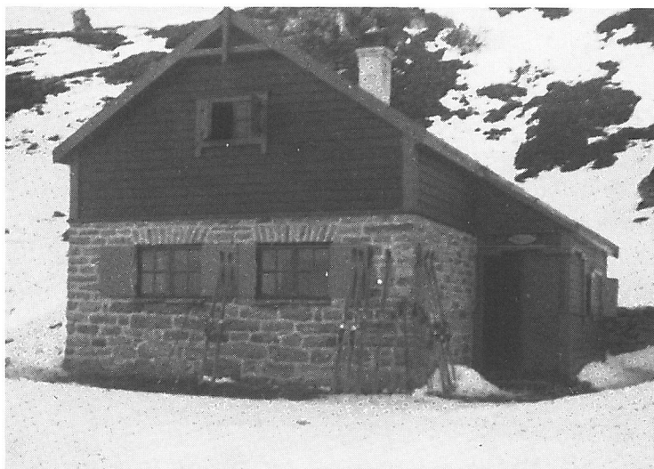
Det var en gang, vinter på Tarlebø.