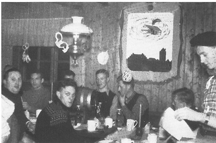
Glade Pallas-gutter på tur til Tarlebø.