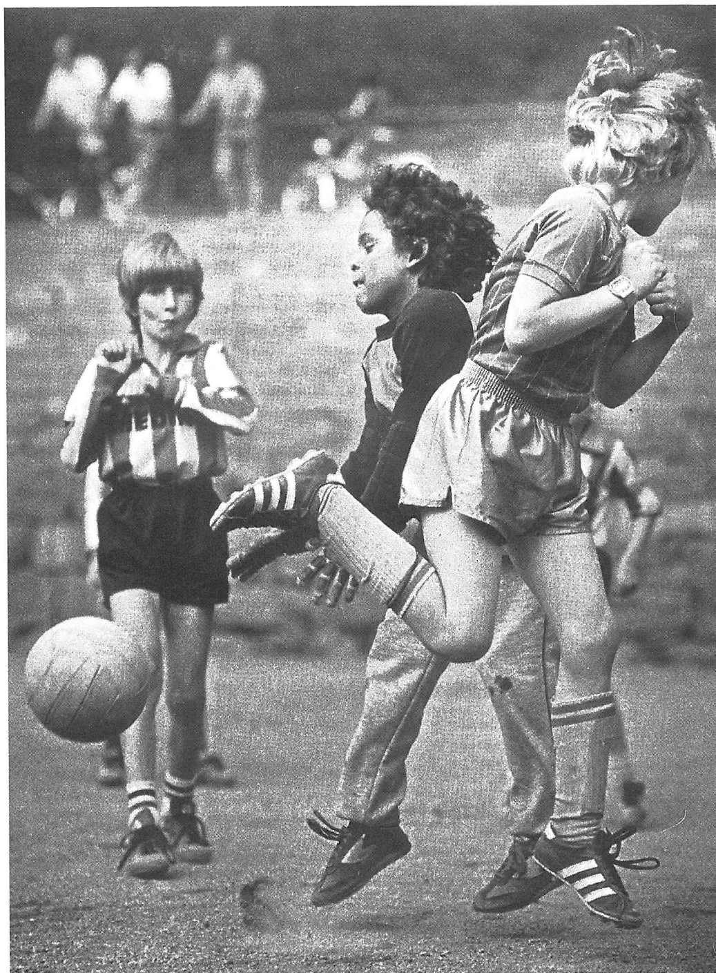
Varegg-keeperen (mørk trøye) fikk en travel ettermiddag mot Frøya på Mulebanen i 1984.