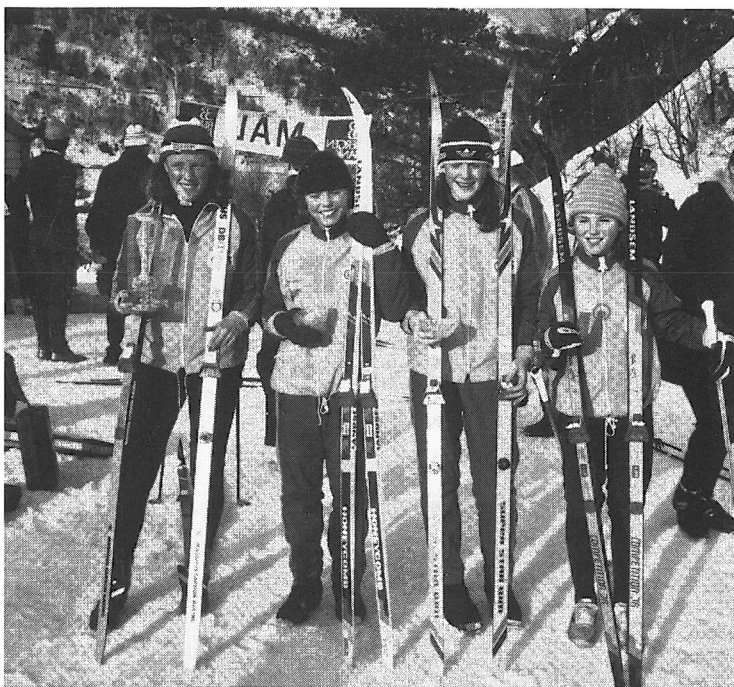
Glade skijenter etter et renn.

Hun ble kretsmester både i yngste og eldste pikeklasse og vant også to kretsmesterskap i stafett, ett for piker og ett for damer.