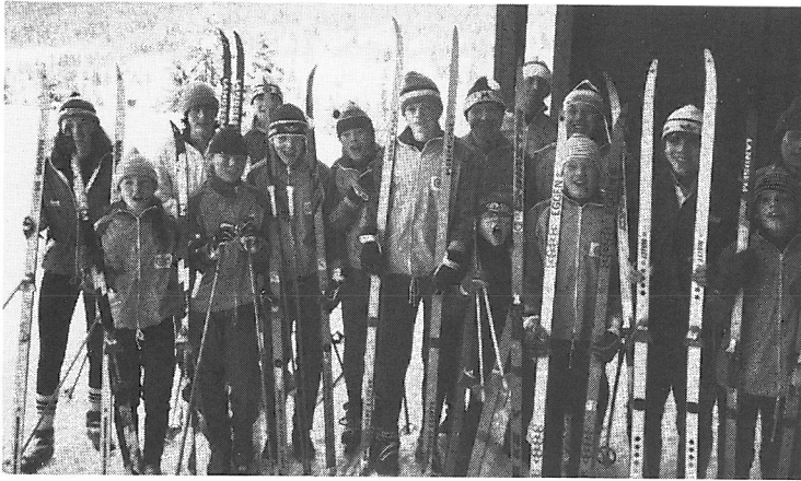
Skirekutter på tur i 80-årene. Ikke noe å si på stemningen.

klubbene. Det ligger mange felles harde og våte dugnads-timer bak den 2 km lange lysløypen på Midtfjellet. Dugnaden ble utført på kveldstid. Hver lørdag kl 10.00 var fast møtedag.