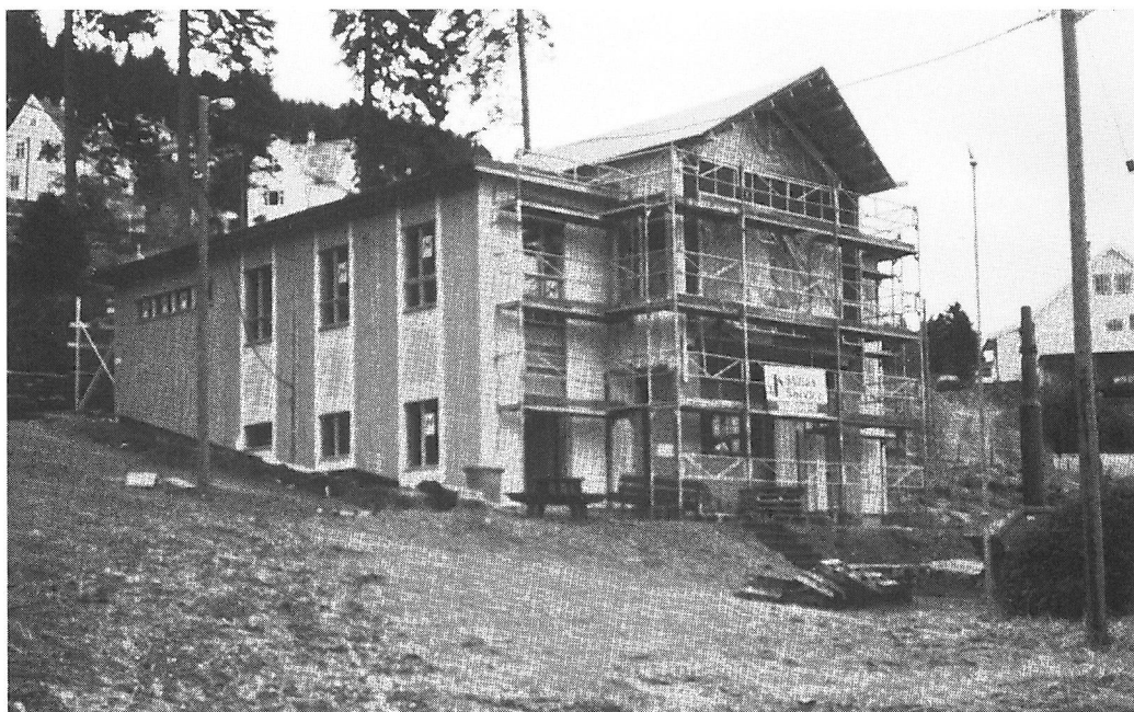
Badstuen i ombygget skikkelse, mars 1997.