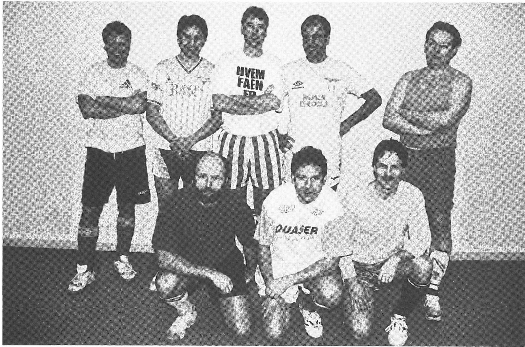
Varegg Old Boys 1997.